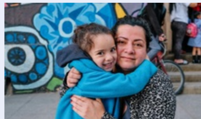
Seguridad y bienestar integral de niñas y niños