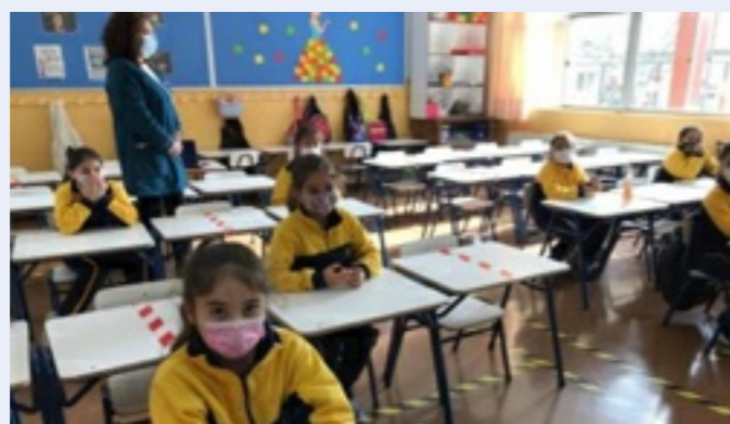
Herramienta que contribuye a mejorar la gestión educativa y convivencia escolar