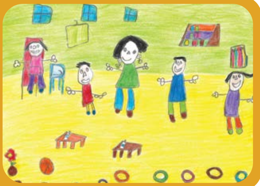
Abigail Llanquino, 5 años, Región de La Araucanía

Una necesidad básica para el crecimiento, y la realización individual y colectiva del ser humano.